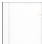
7500 Dopravní bílá krycí RAL 9016