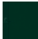
7283 Jedlově zelená krycí RAL 6009